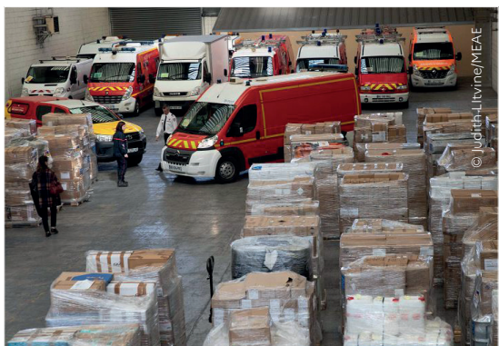
Véhicules de pompiers et matériels de secours