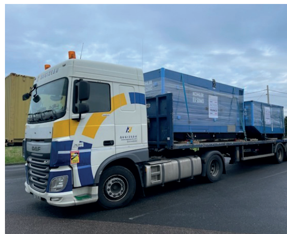
Camion semi-remorque transportant des générateurs vers la Moldavie