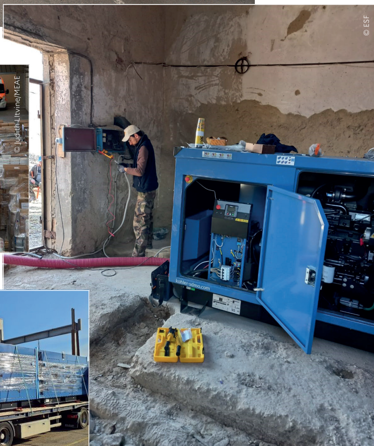
Installation d'un groupe électrogène en Moldavie par Électriciens sans frontières